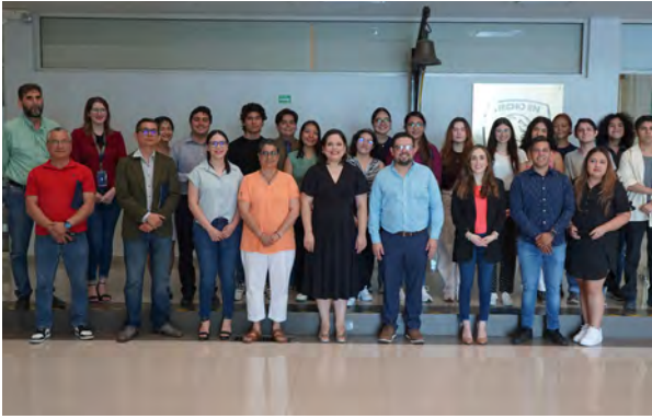
Verano de Investigación Científica Provericyt