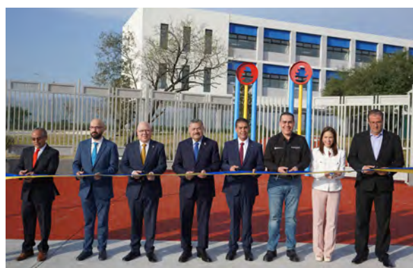
Unidad Académica en Juárez, Nuevo León