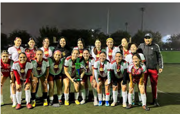
Campeonas Torneo Universitario