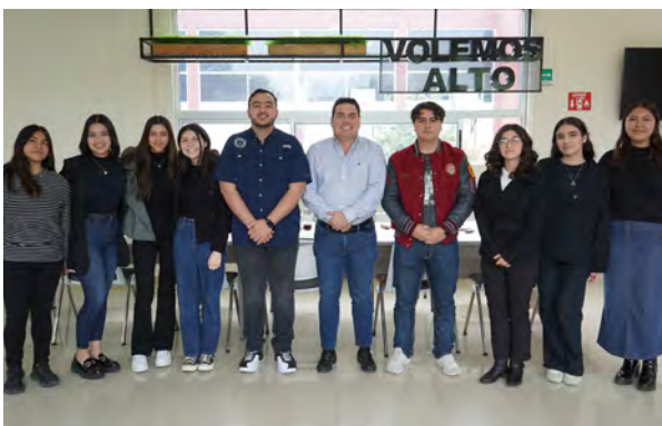
Reunión con representantes de grupo