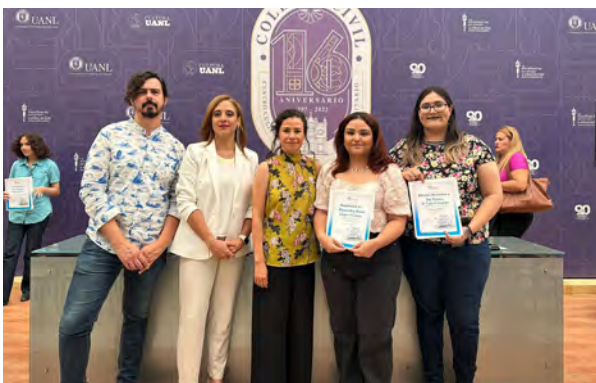
Concurso de Literatura UANL