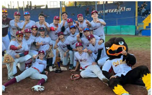
Campeones Torneo Universitario