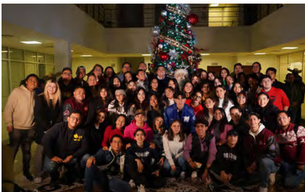
Encendido del Pino Navideño