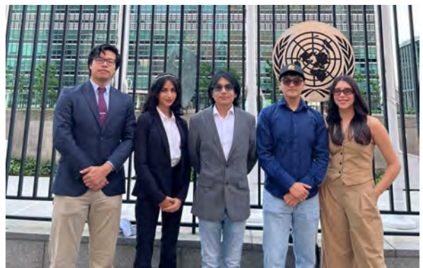
Estudiantes visitan sede de la ONU en Nueva York