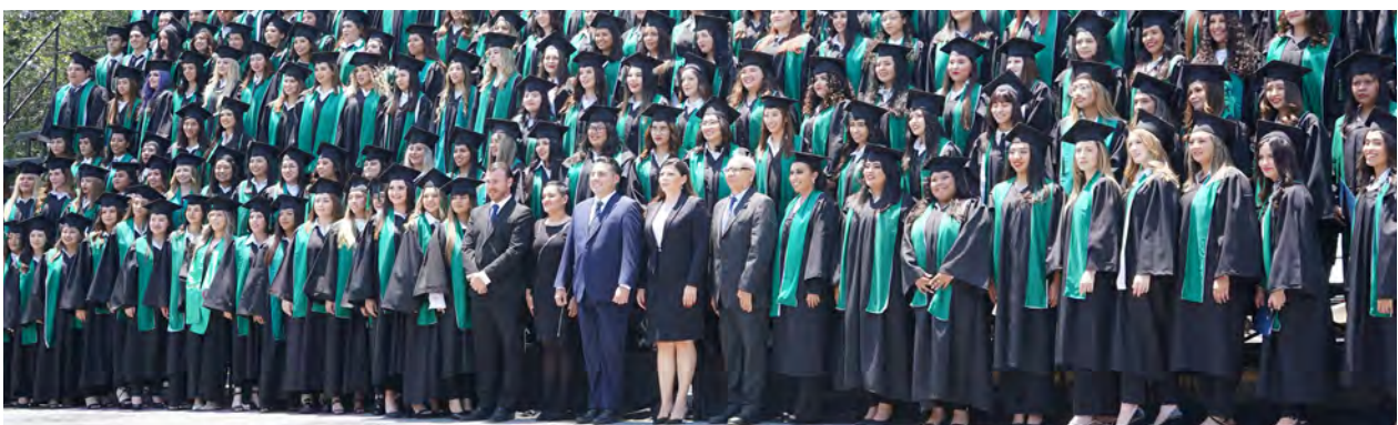
Ceremonia de Graduación