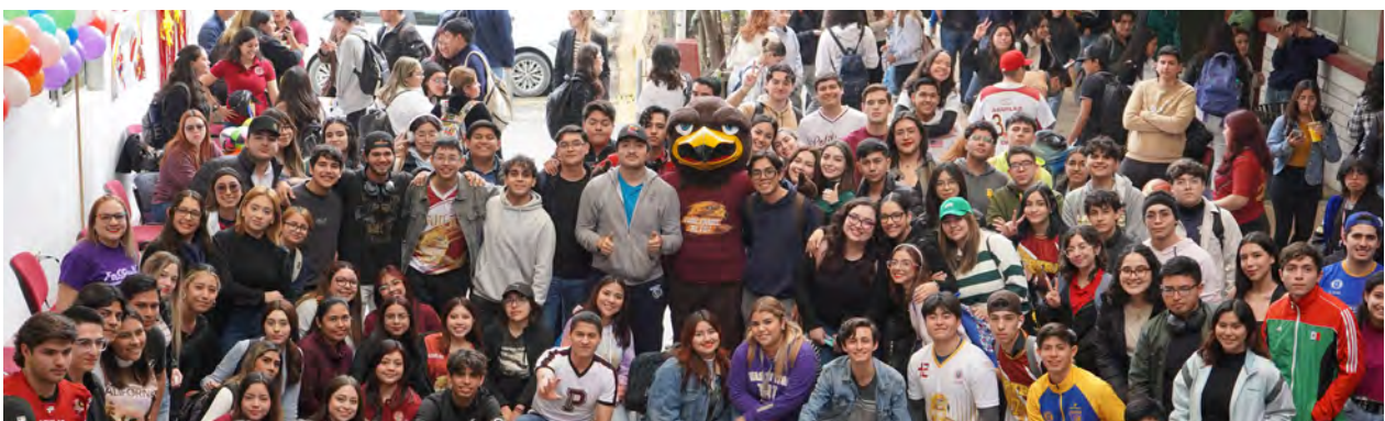
Feria de Actividades Estudiantiles