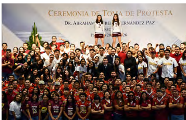
Toma de Protesta como Director