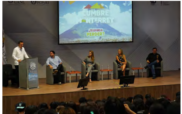
Conferencia "Cumbre Mundial de Comunicación Política"