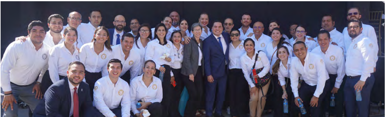
90 Aniversario de la UANL