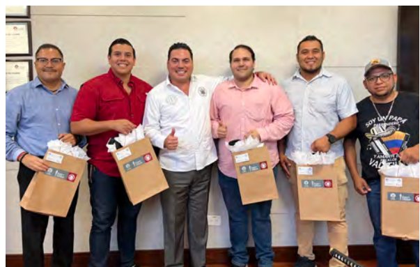
Día del padre