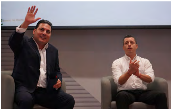
Conferencia Luis Donaldo Colosio, Alcalde de Monterrey