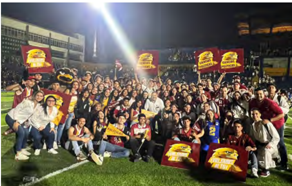
Inauguración del Torneo Universitario