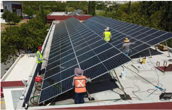
Sistema de paneles solares