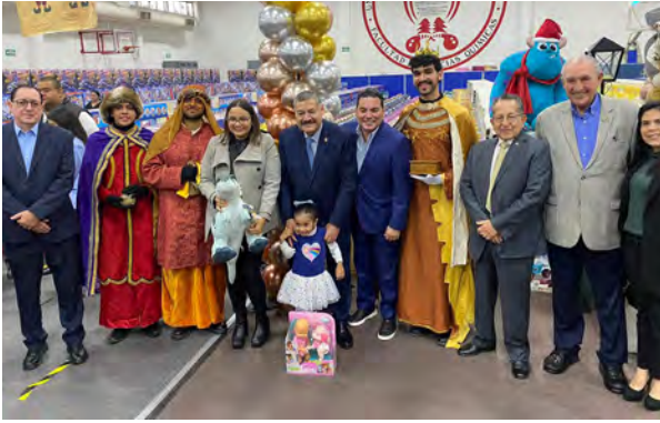
Entrega de regalos Sindicato de Trabajadores UANL