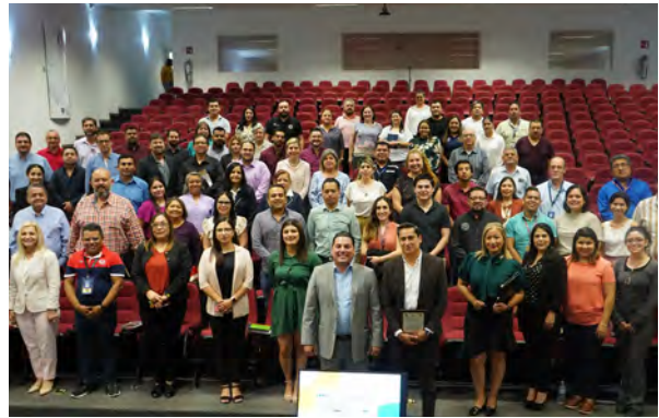
Curso sobre Transparencia UANL