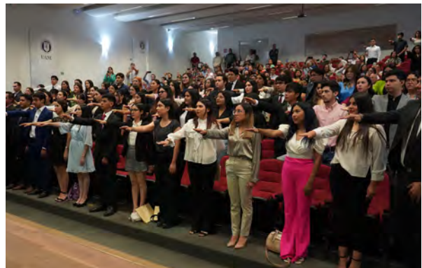
Toma de Protesta egresados Licenciatura