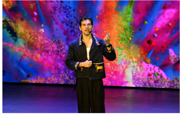
Motor de México