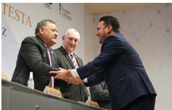
Toma de Protesta como Director