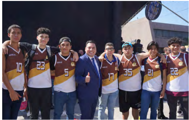
90 Aniversario de la UANL