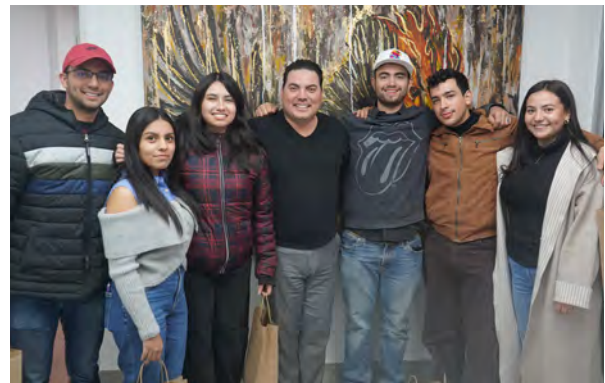
Estudiantes de Movilidad Académica