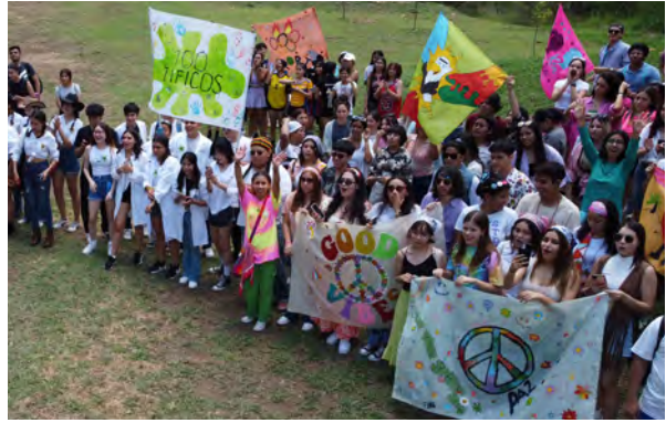
Rally de cursos inductivos