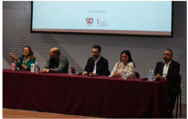
Foro con egresadas y egresados