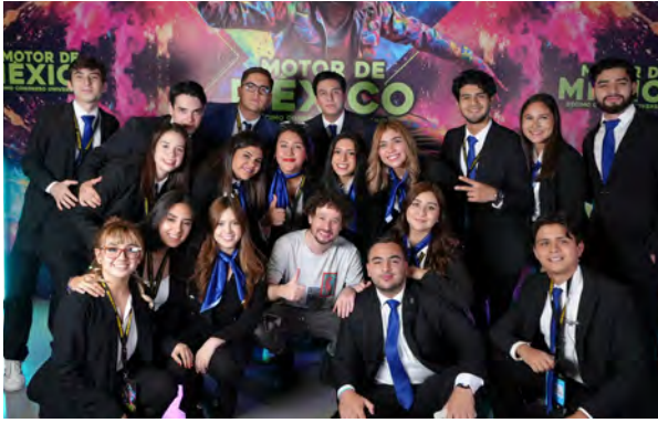
Motor de México