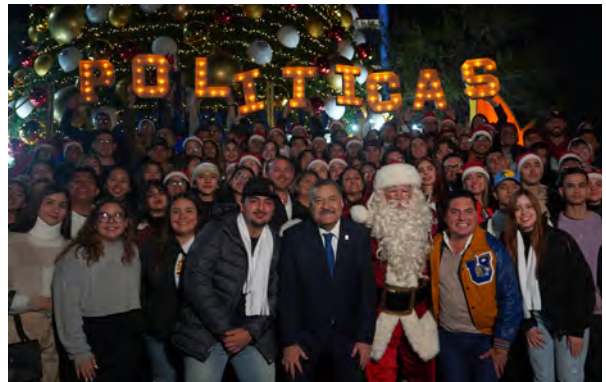
Encendido del Pino Navideño UANL