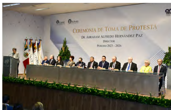
Toma de Protesta como Director