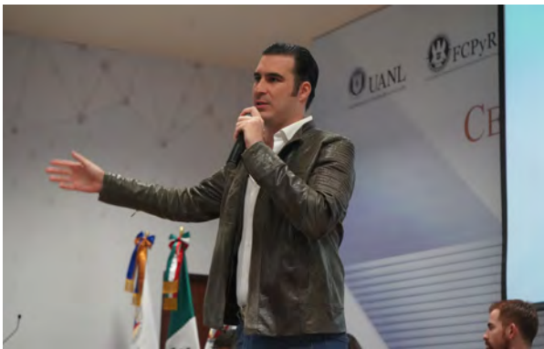
Conferencia Dip. Miguel Torruco