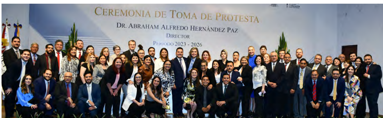
Toma de Protesta como Director