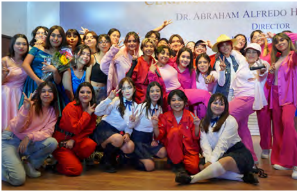
Cierre de talleres AFI