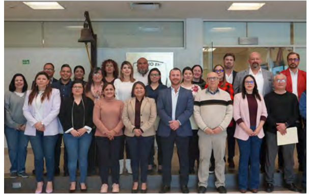
Coordinaciones de Academia