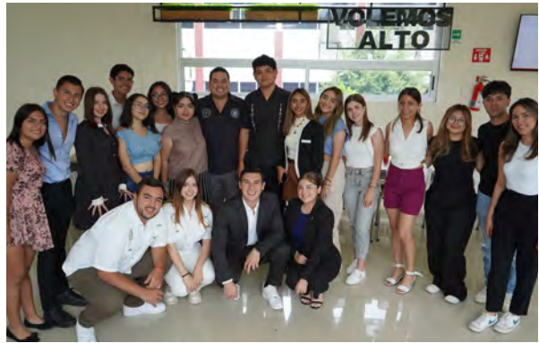
Reunión con representantes de grupo