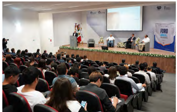
Foro del Agua en Nuevo León