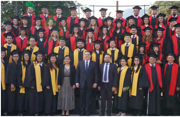
Graduación Maestría y Doctorado